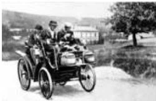
Le tricycle d'Edouard

(Voyage au bout de la nuit, Gallimard, Folio, p.404).