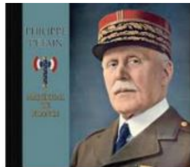
La promenade de Pétain

Le premier tricycle d'Edouard c'était un monocylindre, trapu comme un obusier avec un demi-fiacre par devant. On s'est levé ce dimanche-là encore bien plus tôt que d'habitude. On m'a torché le cul à fond. On a attendu une heure, au rendez-vous de la rue Gaillon que l'engin arrive. Le départ pour la randonnée c'était pas une petite affaire. Ils s'étaient mis au moins six pour le pousser depuis le pont Bineau. On a rempli les